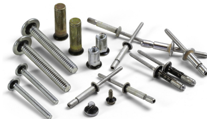
Conventional O-Ring GOOD

不兼容碳氢化合物： 因为ND Plastisol 不耐碳氢化合物，ND Sealtek产品系列，建议在接触燃料或油的应用。